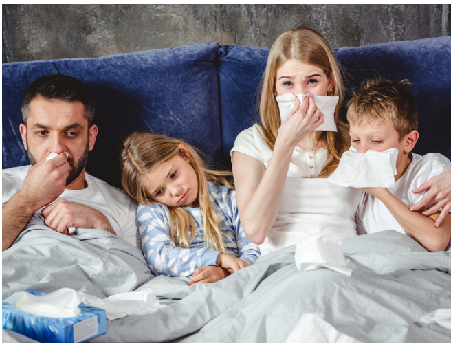
Грипп грозит осложнениями, его нельзя переносить на ногах

По словам эксперта, понять, чем именно вы заболели, гриппом или ОРЗ, просто.