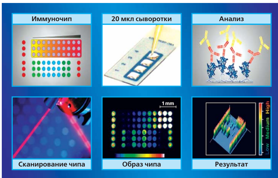
Рис. 2. Принцип работы тест-системы для серодиагностики на основе иммуночипа.

и промышленная база производства в РФ средств нового поколения для высокоэффективной диагностики инфекционных и аллергических заболеваний человека». Одним из основных разработчиков программы выступило Федеральное государственное учреждение науки «Центральный научно-исследовательский институт эпидемио-