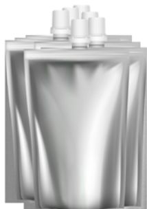
Пакеты – 6 шт.