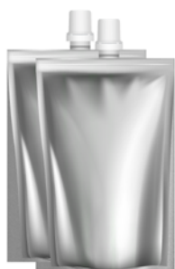
Пакеты – 2 шт.