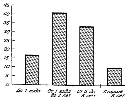
Рис. 2. Частота обнаружения hMPV в разных возрастных группах (в процентах от числа детей данной возрастной группы, принявших участие в исследовании).

Клиническую картину заболевания удалось проследить у 51 пациента. Среди симптомов, отмечен-